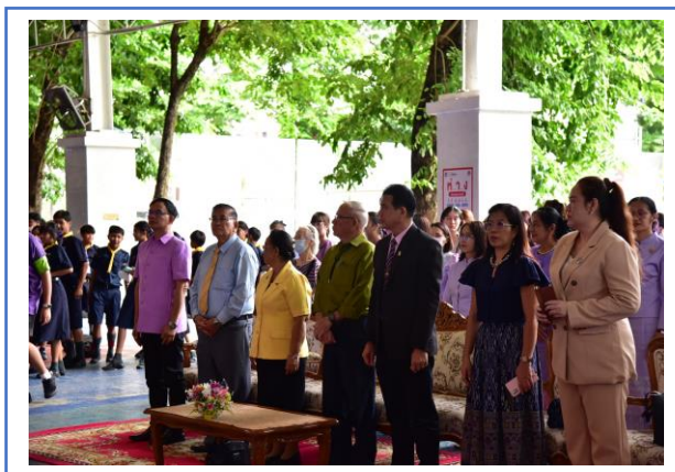
กิจกรรมวันกตัญญูปู่เหียน