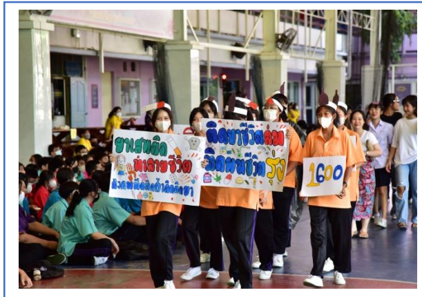
กิจกรรมวันต่อต้านยาเสพติดโลก