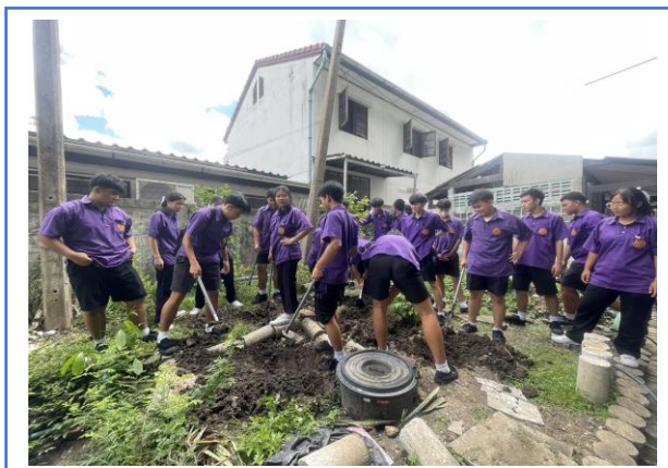
กิจกรรมการอนุรักษ์สิ่งแวดล้อม