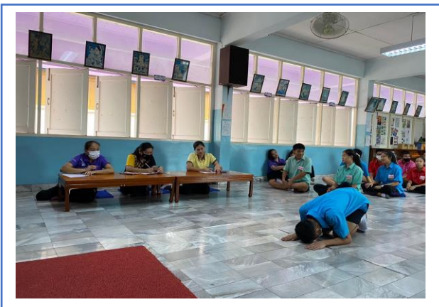
กิจกรรมการประกวดมารยาทไทย