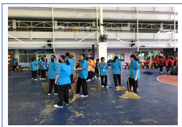
กิจกรรมบำเพ็ญประโยชน์