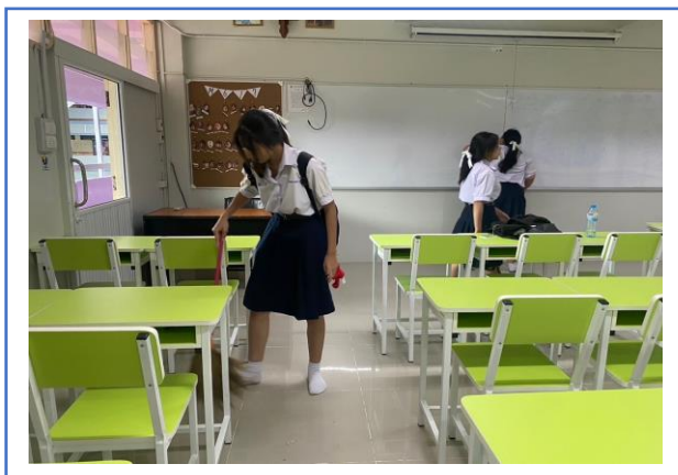
กิจกรรมการทำความสะอาดห้องเรียน