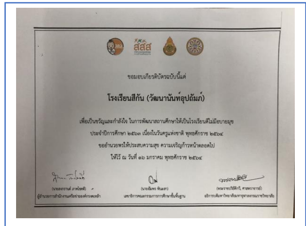
รางวัลโรงเรียนคุณธรรม สพฐ. ระดับ ๓ ดาว