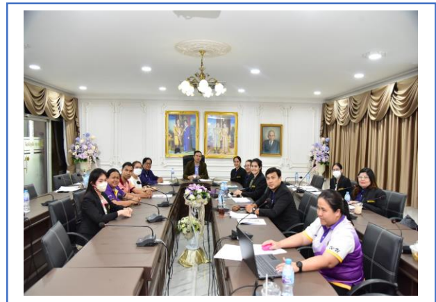
การประชุมการจัดทำแผนปฏิบัติการประจำปี