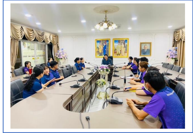
การประชุมวางแผนการดำเนินงานและมอบหมายงาน