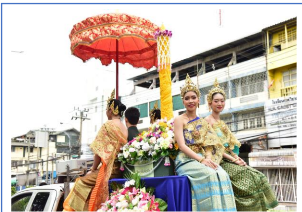
กิจกรรมแห่เทียนจำนำพรรษา