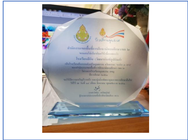
โรงเรียนได้รับรางวัลโรงเรียนคุณธรรม สพฐ. ระดับ ๒ ดาว และระดับ ๓ ดาว ของ สพม. กท๒