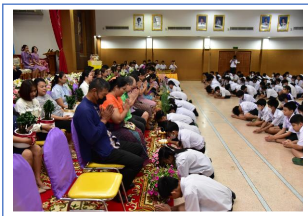
กิจกรรมวันไหว้ครู