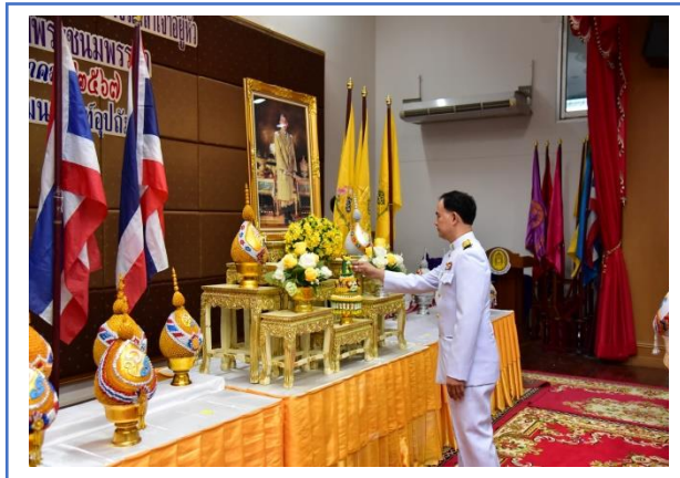
พิธีถวายพระพรวันเฉลิมพระชนมพรรษาฯ