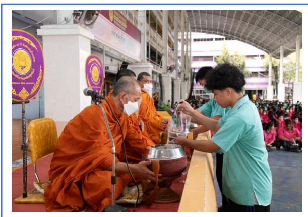
กิจกรรมทำบุญตักบาตรวันสำคัญทางศาสนา